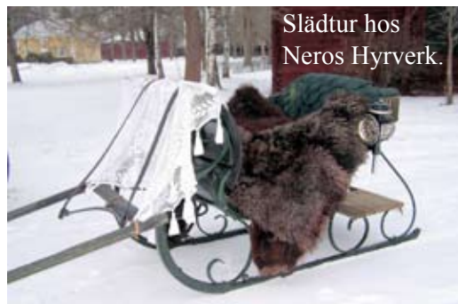
Slädtur hos Neros Hyrverk.